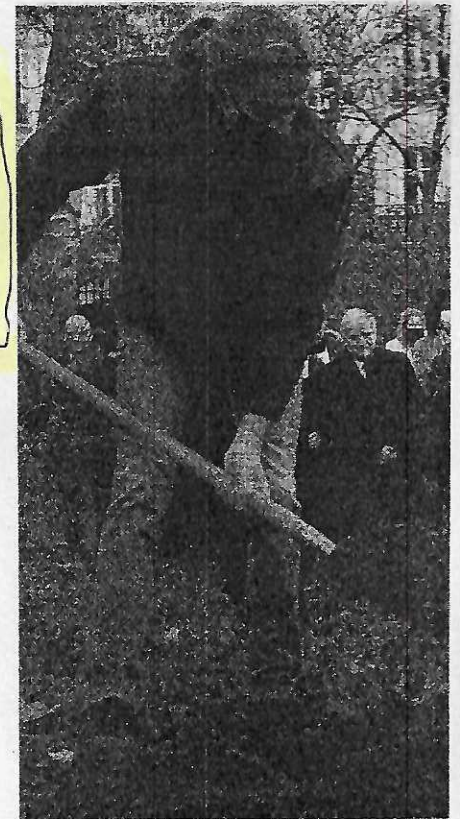
Le président français Emmanuel Macron jardinier planter un arbre dans le jardin de

À 102 ans, la doyenne de Saint-Pons, Tracadie, n'a pas l'intention de quitter sa demeure. Elle mène une vie tranquille mais aussi sécuritaire grâce à un appareil lui permettant de donner l'alarme, qu'elle porte autour du cou.